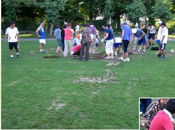
サッカーチーム“はやぶさ” の保護者の皆さん