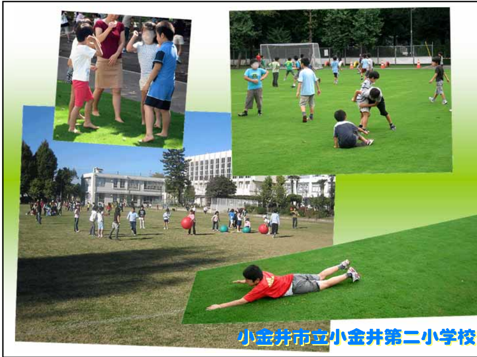
小金井市立小金井第二小学校