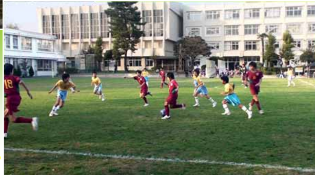
サッカーチーム “はやぶさ”