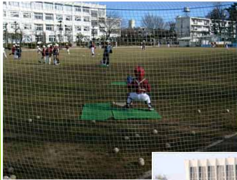
野球チーム “ビクトリー”